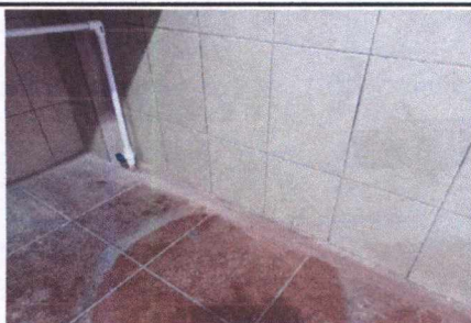
FOTO 5: INSTALACIÓN DE SISTEMA DE AGUA DESDE ACOMETIDA HACIA CISTERNA