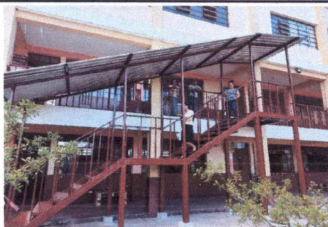
FOTO 2: ESTRUCTURA DE SOPORTE DE METAL Y CUBIERTA DE LÁMINA PARA MÓDULO DE GRADAS DE EMERGENCIA