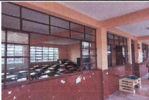
FOTO 1: MODIFICACIÓN DE ESTRUCTURA DE VENTANAS DE METAL A CORREDIZAS