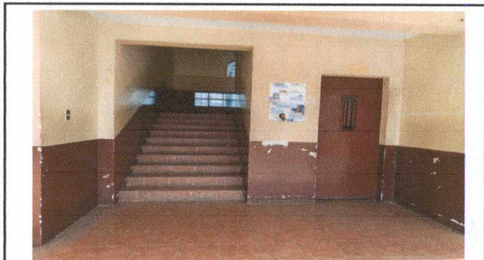
Foto 4: Unicas gradas de emergencia hacia los tres niveles, con más de 500 alumnos.