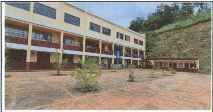
Foto 5: Espacio donde se construirá un módulo de gradas. Es muy indispensable un módulo de gradas para que los alumnos cuenten por lo menos con unas gradas de emergencia en algún momento de riesgo.