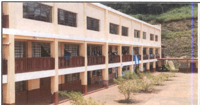
Foto 6: Ala del edificio donde se construirán gradas de emergencia que serán de gran beneficio para la comunidad educativa, serán del primer al segundo nivel.

Observación: Si es necesario se pueden agregar hojas adicionales y actualizar el número de hojas.