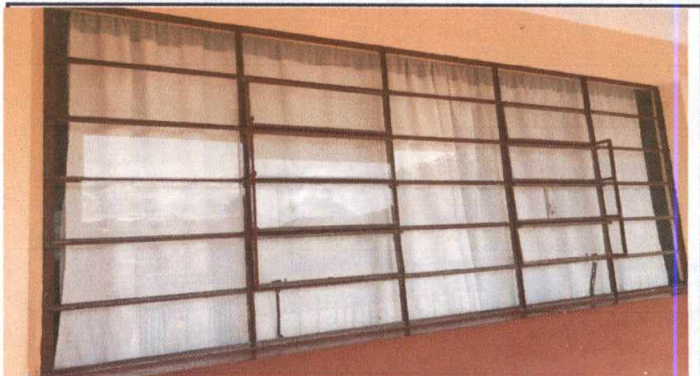
Foto 2: Falta de ventilación en las aulas, por eso se necesita modificar las ventanas, para el flujo de aire pueda ser adecuado y así los alumnos tengan una mejor ventilación.