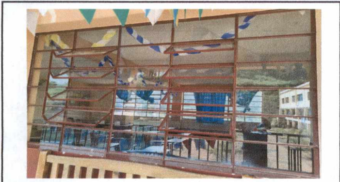
Foto 1: Necesidad de volver corredizas las ventanas, debido a que unicamente se pueden abrir los vidrios que se pueden observar, por lo tanto al hacerlas corredizas el flujo de aire se mejorará en los salones.