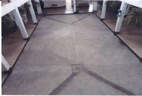
FOTO 6: TRABAJO EXTRA DE MEJORAMIENTO DE DRENAJE DE AGUA PLUVIAL EN PATIO

[Handwritten Signature] Firma y sello del Presidente de la AOPF