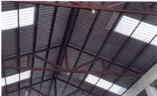
FOTO 4: SUSTITUCIÓN DE PLAFONERAS, SUSTITUCIÓN DE FOCOS AHORRADORES Y SUSTITUCIÓN DE DUCTO Y CABLEADO ELÉCTRICO