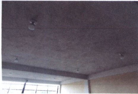
FOTO 3: SUSTITUCIÓN DE FOCOS AHORRADORES EN PRIMER Y SEGUNDO NIVEL