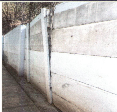
Foto 1: Sustrucción de muro perimetral de planchas de concreto por block.