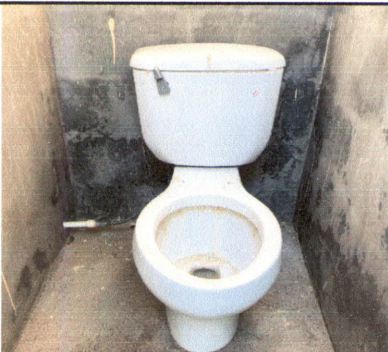
Foto 5: Sustrucción de sanitarios e instalación de piso cerámico y azulejo