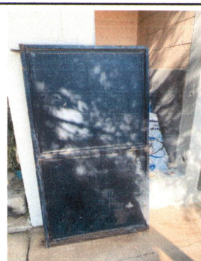
Foto 6: Reparación e instalación de puerta de metal en sanitario.

Observación: Si es necesario se pueden agregar hojas adicionales y actualizar el número de hojas.