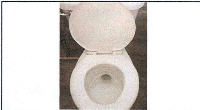
Foto1: Sustitución de inodoro servicio sanitario de niños.