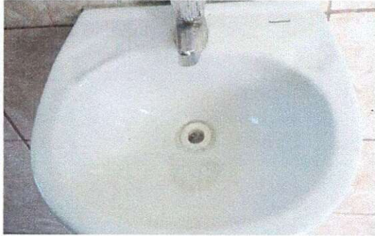
Foto1: Sustitución de lavamanos servicio sanitario de niños.