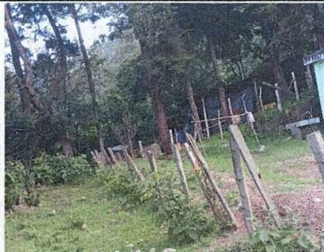
Foto1: Falta de cerco o muro perimetral