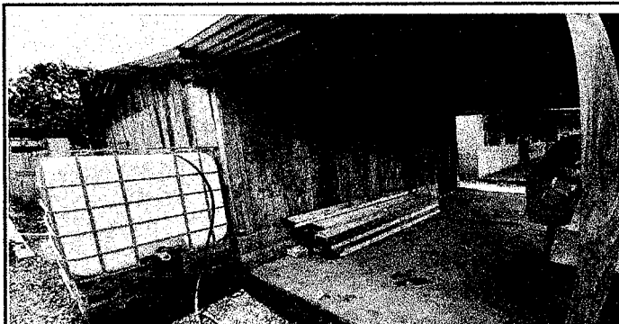
FOTO 01:REPARACION O SUSTITUCION DE ÁREA DE COCINA: Sustrucción de paredes de madera por paredes de block y cubierta de lamina troquelada aluzinc callbre 26 y estructura metalica.