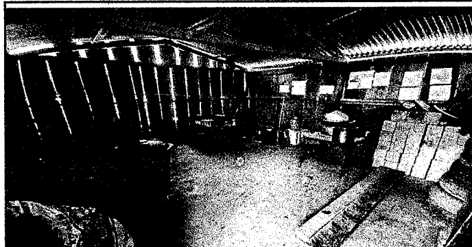
FOTO 02: PISO: Instalacion de piso de granito de fondo gris en área de cocina. Sustrucción de estufa rural(completa) incluye chimenea y plancha de metal.