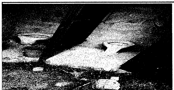
Foto 5: SERVICIOS SANITARIOS EXISTENTES, SE SUSTITUIRAN LETRINAS POR SANITARIOS LAVABLES