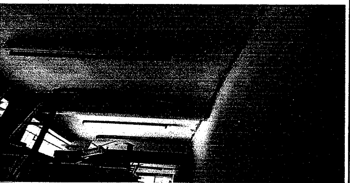
SUSTITUCIÓN DE BASES Y CANDELAS

Observación: Si es necesario se pueden agregar hojas adicionales y actualizar el número de hojas.