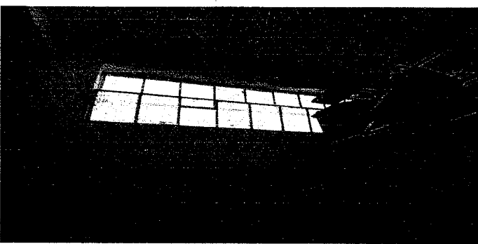
MANTENIMIENTO DE VENTANAS DE METAL