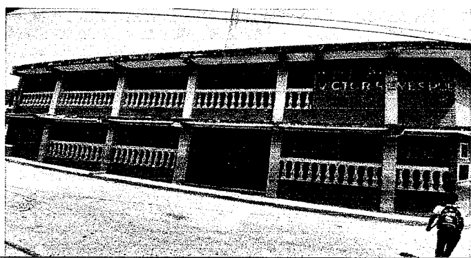
PINTURA COMPLETA A MUROS INTERIORES DEL EDIFICIO