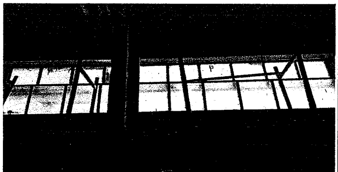
MANENIMIENTO DE VENTANAS Y SUSTITUCIÓN DE VIDRIOS