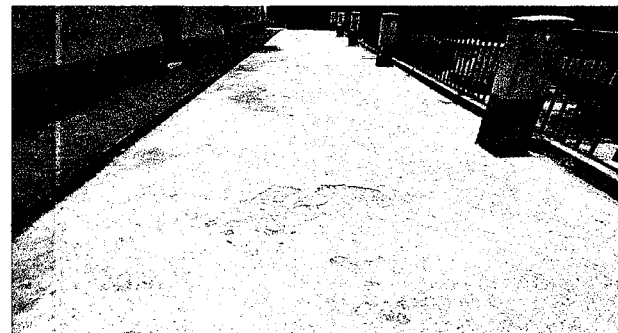
Foto 10: Sustitución de torta de cemento por piso antideslizante ya que este se encuentra en mal estado.