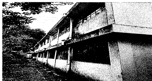
Foto 11: Pintura de las paredes interior y exterior de las aulas ya que todas se encuentran en mal estado.