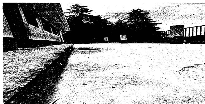
Foto 9: Sustitución de torta de cemento por piso antideslizante ya que este se encuentra en mal estado.