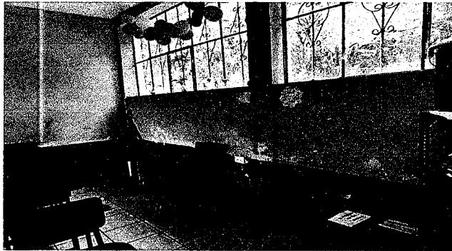
Foto 12: Pintura de las paredes interior y exterior de las aulas ya que todas se encuentran en mal estado.

Observación: Si es necesario se pueden agregar hojas adicionales y actualizar el número de hojas.