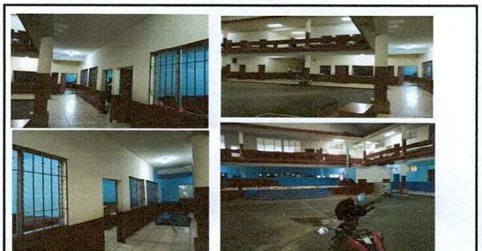
Foto 4: ÁREA DE MODULO DE PINTURA: Pintura en muros interiores 1,200 m2 y pintura en áreas exteriores 800 m2, a dos manos previo a la pintura se deberá de limpiar toda la pintura existente e impureza.