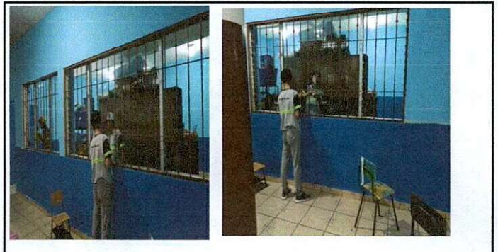
Foto 2: ÁREA DE MODULO DE VENTANAS: Sustitución de paletas de vidrios en salones de clases, 30 ventanas en total, se sustituirán accionamiento y empaques.