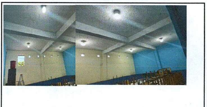
Foto 6: ÁREA DE MODULO DE REPARACIÓN DE SISTEMA ELÉCTRICO: Sustitución de plafoneras por deterioro, sustitución de bombillas, sustitución de apagadores dobles por falso contacto y

Observación: Si es necesario se pueden agregar hojas adicionales y actualizar el número de hojas.