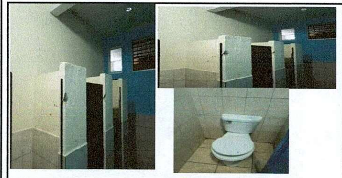
Foto 5: ÁREA DE MODULO DE SANITARIOS Y SUS ACCESORIOS: Sustitución de accesorios inodoro y reparación de un sanitario con fuga, respiraderos con tubo de PVC de 3 pulgadas.