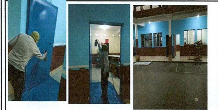
Foto1: ÁREA DE MODULO DE PUERTAS: Mantenimiento de 10 puertas, lijado y pintado a dos manos en ambas caras, puertas de 0.90 x 2.10.