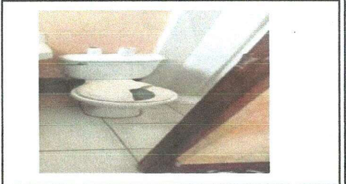
Foto 2: Área de servicio sanitario en mal estado, tapa rota y fuga de agua por estar quebrado, y puerta quebrada