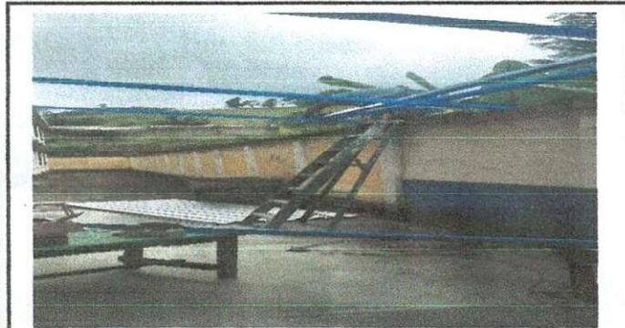
Foto 3: Exterior área de cocina, sustitución de techo de lámina de 12.20 metros cuadrados