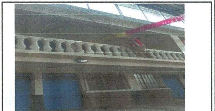
Foto 6: Área de salón, aplicación de pintura en paredes y columnas

Observaciones: Si es necesario se pueden agregar hojas adicionales y actualizar el número de hojas.