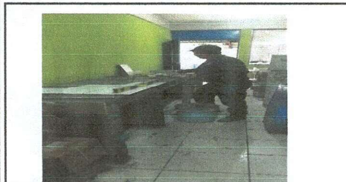
Foto 5: Interior área de cocina, instalación de top planchas de concreto y azulejo