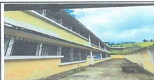
Foto 3: Exterior área de cocina, sustitución de techo de lámina de 12.20 metros cuadrados