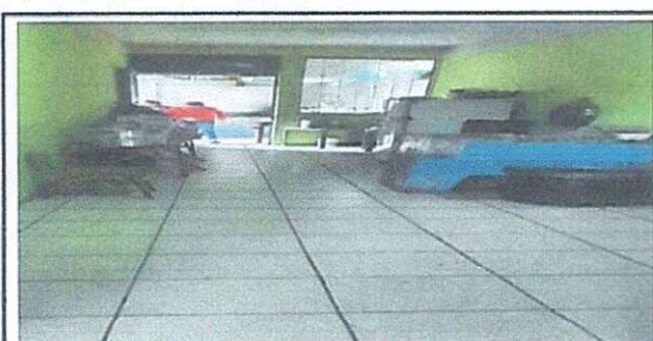
Foto 5: Interior área de cocina, instalación de top planchas de concreto y azulejo