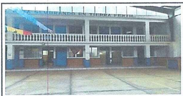
Foto 6: Área de salón, aplicación de pintura en paredes y columnas

Observación: Si es necesario se pueden agregar hojas adicionales y actualizar el número de foto.