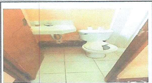
Foto 2: Área de servicio sanitario en mal estado, tapa rota y fuga de agua por estar quebrado, y puerta quebrada