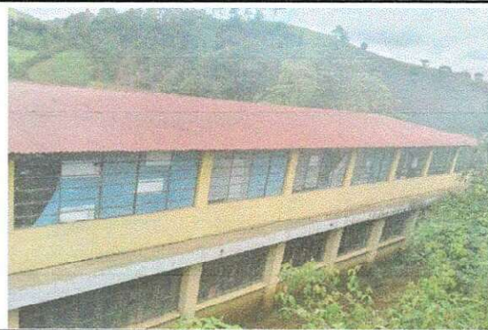
Foto 2: Instalacion de Balcones metalicos en ventanas de segundo nivel.