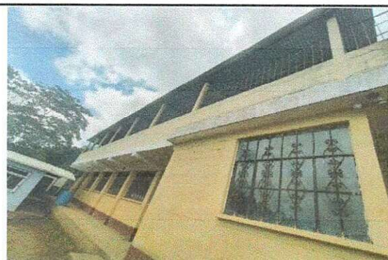
Foto 4: Pintura en muros interiores y exteriores, en diferentes areas.