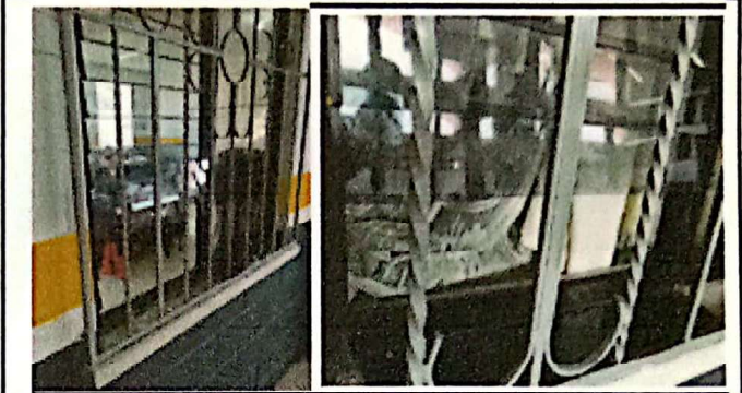
AULAS DEL PRIMER NIVEL CON VENTANAS EN MAL ESTADO Y PALETAS CON CLIPS QUEBRADOS.