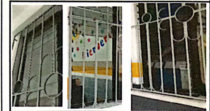
VENTANAS SIN VIDRIOS PORQUE SE CAEN AL INSTALAR LOS NUEVOS DEBIDO A QUE LOS CLIPS SE ABREN.