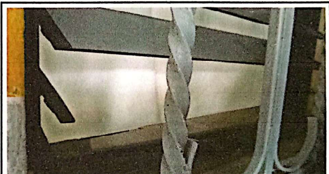
PERILLA PARA ABRIR Y CERRAR DAÑADA Y CLIPS DAÑADOS QUE OCASIONAN QUE LAS PALETAS SE CAIGAN