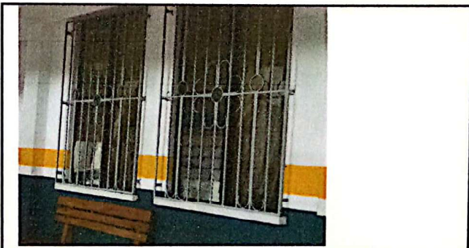
VENTANAS CON VIDRIOS SAFADOS PERO QUE NO SE PUEDEN RETIRAR LOS VIDRIOS PORQUE SE CAE EL RESTO DE VIDRIOS

Observación: Si es necesario se pueden agregar hojas adicionales y actualizar el número de hojas.