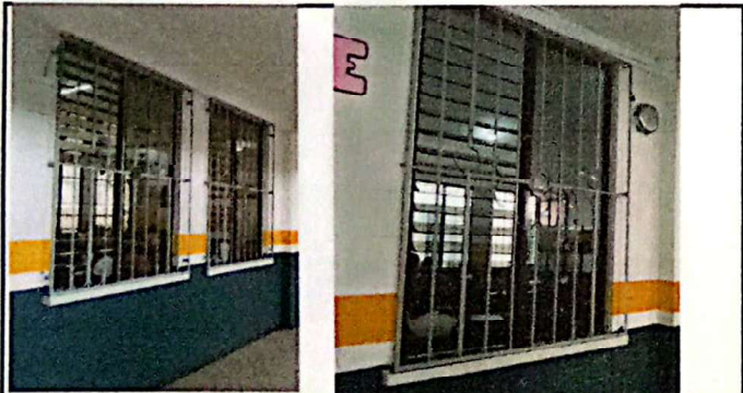
VENTANAS DEL SEGUNDO NIVEL QUE AL TOCARLAS SE CAEN LAS PALETAS