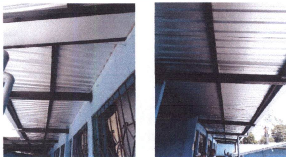
Foto 5: CUBIERTA DE LÁMINA Sustitución de lámina acanalada por lámina troquelada calibre 26 en corredor del segundo piso al fondo y aulas de 3ro.A, 2do.A, 2do.C, 3ro.B y 2do.B