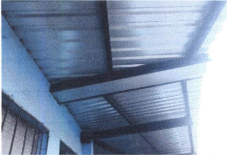
Foto1: CANALES Y BAJADAS DE AGUA PLUVIAL Instalación de canal entre los salones de 2do.A y 2do.C