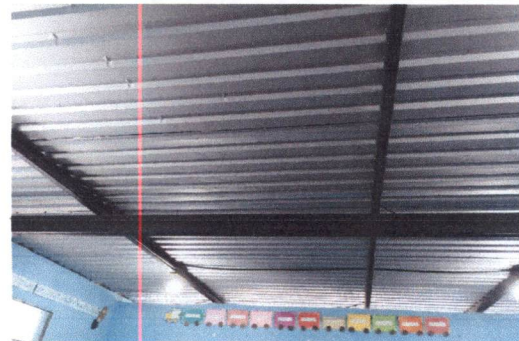
Foto 4: ESTRUCTURA DE TECHO en 3ro.C Desmontaje de techo enlaminado e instalación de techo.