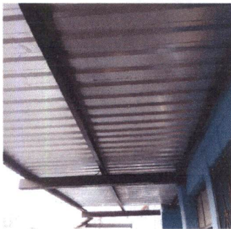
Foto 3: CUBIERTA DE LÁMINA Sustitución de lámina acanalada por lámina troquelada calibre 26 en corredor del segundo piso al fondo y aulas de 3ro.A, 2do.A, 2do.C, 3ro.B y 2do.B