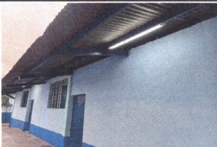
FOTO 5: INSTALACIÓN DE LÁMPARAS TIPO LED DE 2 TUBOS EN ÁREA EXTERIOR DE SALÓN