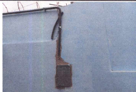
FOTO 9: SUSTITUCIÓN DE CABLEADO ELÉCTRICO EN ACOMETIDA Y CAMBIO DE BASES EN CAJA SOCKET