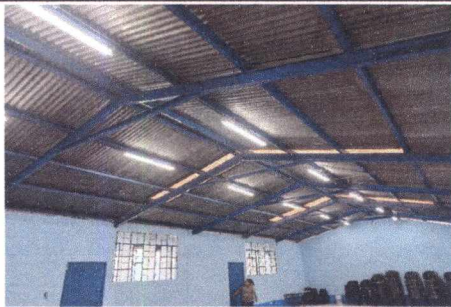
FOTO 3: INSTALACIÓN DE LÁMPARAS TIPO LED DE 2 TUBOS EN INTERIOR DE SALÓN