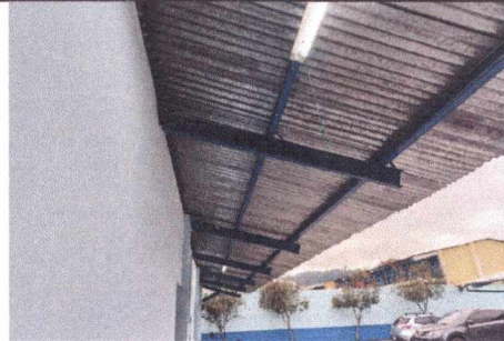
FOTO 4: INSTALACIÓN DE LÁMPARAS TIPO LED DE 2 TUBOS EN ÁREA EXTERIOR DE SALÓN