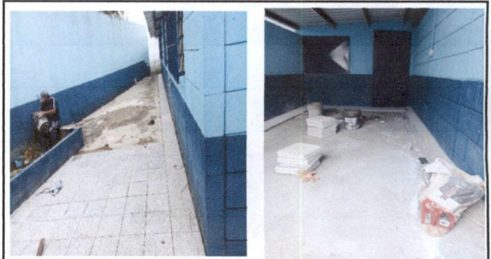
Foto 4: Sustitución de torta de concreto por piso de granito corredor Preprimaria, también el espacio de Tienda Escolar.