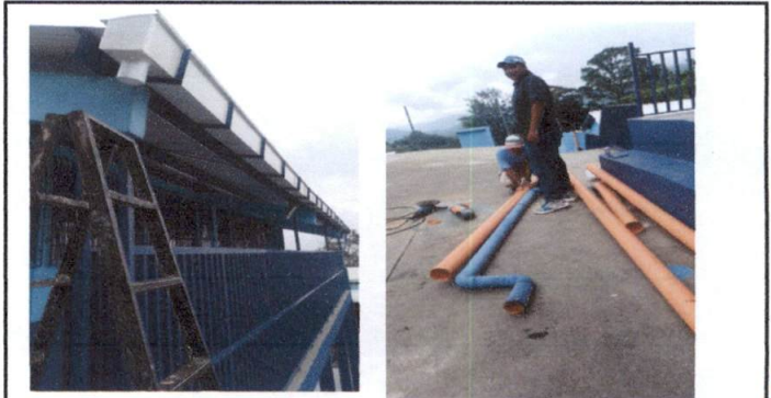
Foto 6: Sustitución de bajadas de agua ( tubo de 4") de agua mantenimiento de canales del módulo 1 de Primaria y salón de usos múltiples.

Observación: Si es necesario se pueden agregar hojas adicionales y actualizar el número de hojas.