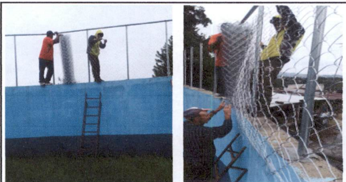
Foto 4: Colocación de tubo hg y malla galvanizada en muro perimetral donde se encuentra la cancha polideportiva