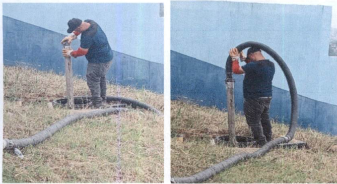
Foto1: Limpieza de fosa séptica