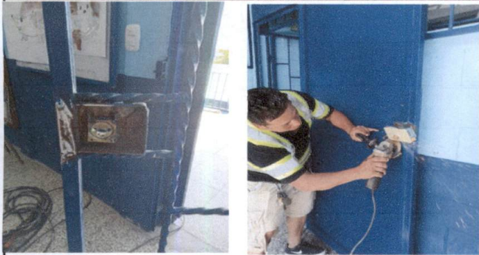
Foto1: Sustitución de chapas en CREA