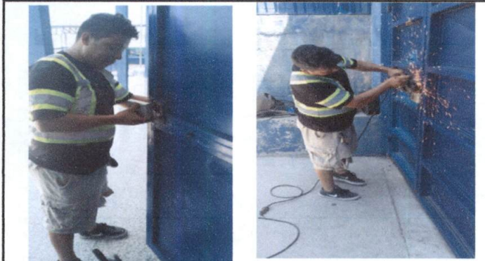
Foto 3: Sustitución de chapa del depósito de basura de la jornada matutina (se arruinó la chapa por eso se usa candado) y del portón( se juega la llave).