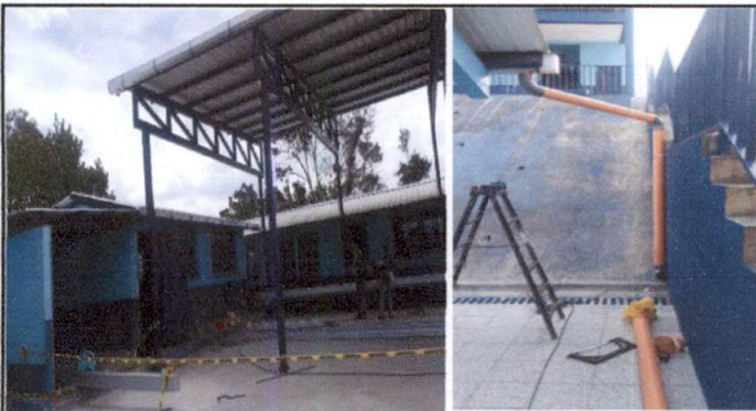
Foto 3: Trabajo de canales y bajadas de agua en techo de patio de Preprimaria y techo de módulo 2 de Primaria.