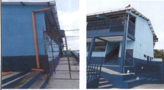
Foto1: Mantenimiento de canales del salón de usos múltiples y módulo 1 de Primaria