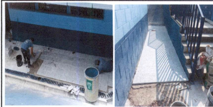
Foto 5: Sustitución de torta de concreto por piso de granito corredor de Primaria módulo 2.