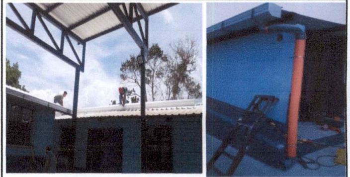
Foto 2: Trabajo de canales y bajadas de agua en aulas de Preprimaria y techo de Tienda Escolar