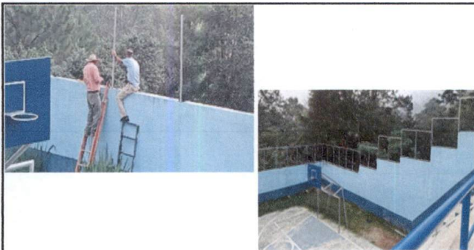
Foto 3: Colocación de tubo hg y malla galvanizada en muro perimetral donde se encuentra la cancha polideportiva