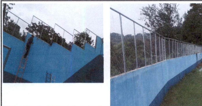
Foto 5: Colocación de tubo hg y malla galvanizada en muro perimetral donde se encuentra la cancha polideportiva