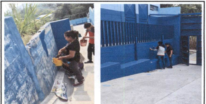
Foto 6: Foto 3: Pintar zócalo de las paredes externas de la escuela

Observación: Si es necesario se pueden agregar hojas adicionales y actualizar el número de hojas.