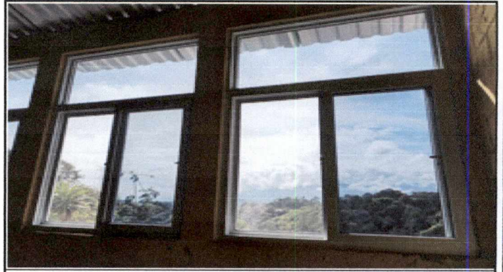
Foto 4: Sustitucion de ventana de metal por ventana de PVC con medidas de 181 metros de alto por 124 metros de ancho incluye cambio de vidrio de los salones 1, 2 y 3 del segundo nivel.