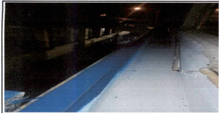
Foto 5: Impermeabilizacion de 22 mts cuadrados de canal de cemento, reparacion de paredes laterales e inferior de 22 mts cuadrados de canal de cemento existente, eliminando grietas y fisuras con cerrado fino con cemento y arena de rio, en el pasillo de los salones 1, 2 y 3 del segundo nivel.