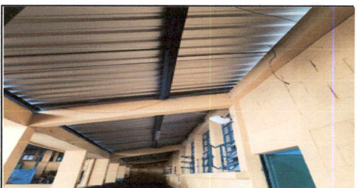
Foto 3: Aplicación 220 mts cuadrados de pintura a estructura metalica, costaneras de color azul de secado rapido incluye limpieza y lijado, despues del desmontaje de laminas de debera retocar los desperfectos que sufra la pintura, para las aulas 1, 2, 3 y corredor del segundo nivel

Observación: Si es necesario se pueden agregar hojas adicionales y actualizar el número de hojas.