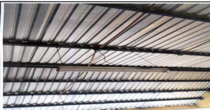
Foto 2: Desmontaje de lamina duralita existente, e instalacion de 190 mts cuadrados de lamina troquelada perfin E25, calibre 26 recubrimiento de aluminio y zinc, color natural aluminizado, fijadas a las costaneras mediante tornillos AURT APLUS(A+) 5/16x2" punta de broca con empaque de neopreno, con un minimo de 3 tornillos en cada lamina, en los salones 1, 2 y 3 del segundo nivel