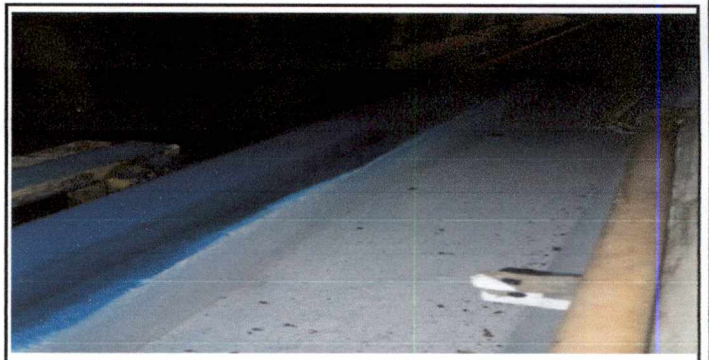
Foto 5: Impermeabilizacion de 22 mts cuadrados de canal de cemento, reparacion de paredes laterales e inferior de 22 mts cuadrados de canal de cemento existente, eliminando grietas y fisuras con cerrado fino con cemento y arena de rio, en el pasillo de los salones 1, 2 y 3 del segundo nivel.