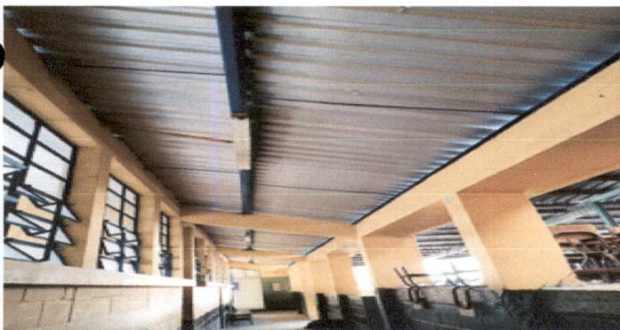
Foto 3 : Aplicación 220 mts cuadrados de pintura a estructura metalica, costaneras de color azul de secado rapido incluye limpieza y lijado, despues del desmontaje de laminas de debera retocar los desperfectos que sufra la pintura, para las aulas 1, 2, 3 y corredor del segundo nivel