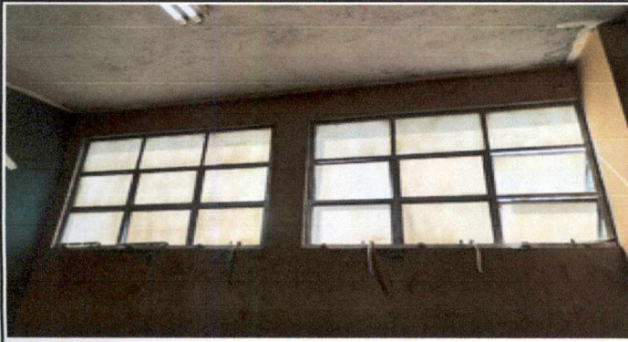
Foto1: Mantenimiento de estructura de ventana y vidrio a 12 metros cuadrados incluyendo limpieza y pintura, en salones 2 y 3 del primer nivel.