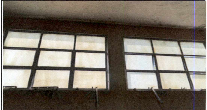
Foto1: Mantenimiento de estructura de ventana y vidrio a 12 metros cuadrados incluyendo limpieza y pintura, en salones 2 y 3 del primer nivel.