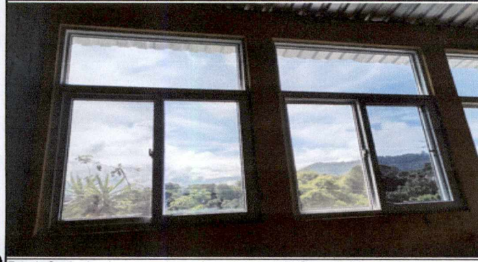
Foto 4: Sustitucion de ventana de metal por ventana de PVC con medidas de 181 metros de alto por 124 metros de ancho incluye cambio de vidrio de los salones 1, 2 y 3 del segundo nivel.