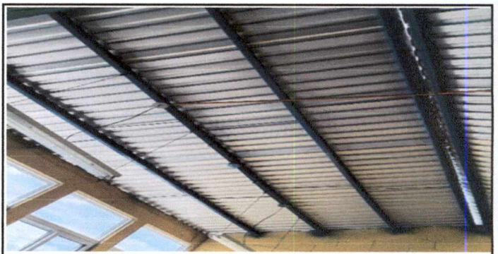
Foto 2: Desmontaje de lamina duralita existente, e instalacion de 190 mts cuadrados de lamina troquelada perfin E25, calibre 26 recubrimiento de aluminio y zinc, color natural aluminizado, fijadas a las costaneras mediante tornillos AURT APLUS(A+) 5/16x2" punta de broca con empaque de neopreno, con un minimo de 3 tornillos en cada lamina, en los salones 1, 2 y 3 del segundo nivel