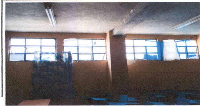
Foto1: Mantenimiento de estructura de ventana y vidrio a 12 metros cuadrados incluyendo limpieza y pintura, en salones 2 y 3 del primer nivel.