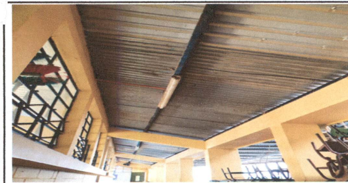
Foto 5: Aplicación 220 mts cuadrados de pintura a estructura metalica, costaneras de color azul de secado rapido incluye limpieza y lijado, despues del desmontaje de laminas de debera retocar los desperfectos que sufra la pintura, para las aulas 1, 2, 3 y corredor del segundo nivel