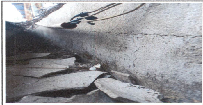
Foto 6: Impermeabilizacion de 22 mts cuadrados de canal de cemento, reparacion de paredes laterales e inferior de 22 mts cuadrados de canal de cemento existente, eliminando grietas y fisuras con cemento fino con cemento y arena de rio, en el pasillo de los salones 1, 2 y 3 del segundo nivel.

Observación: Si es necesario se pueden agregar hojas adicionales y actualizar el registro de trabajos.