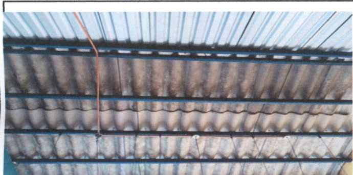
Foto 3: Desmontaje de lamina durabita existente, e instalacion de 190 mts cuadrados de lamina troquelada perfil C25, calibre 26 recubrimiento de aluminio y zinc, color natural aluminizada, fijadas a los costaneros mediante tornillos AURT APUS(A+) 5/16x2" punta de broca con empaque de neopreno, con un minimo de 3 tornillos en cada lamina. en los salones 1, 2 y 3 del segundo nivel