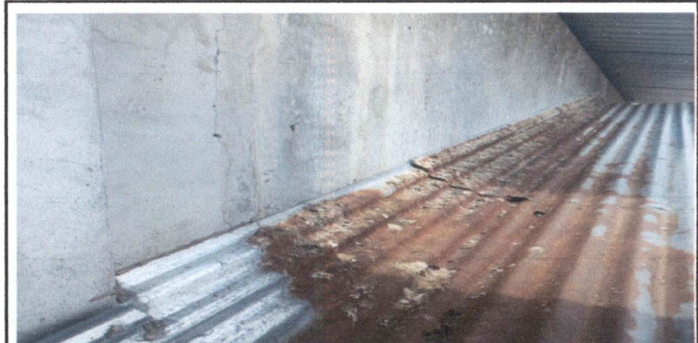
Foto 4: Desmontaje de 8 mts de flashin existente de lamina galvanizada y fabricacion e instalacion de 9 de mts lineares de flashin de lamina lisa, recubrimiento de aluminio de 0.20 a luz zinc calibre 26 se sellaron las uniones y juntas de pared de jv con sellador sikaflex color blanca en los salones 1, 2 y 3 del segundo nivel