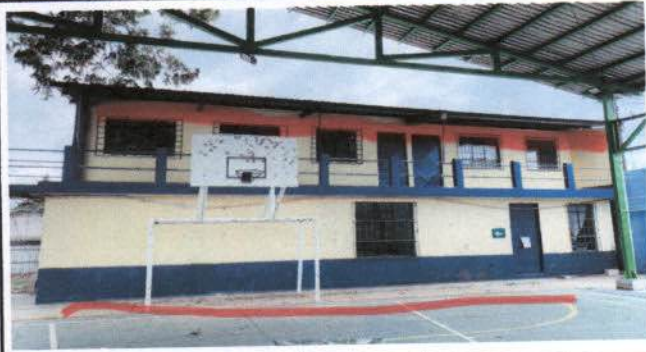
Foto1: 1. Apertura de cuneta. 2. colocar canal. 3. caja de registro