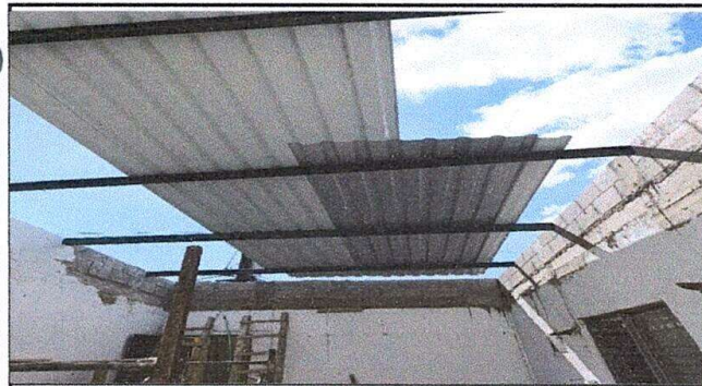
Foto: 1 cambio de techo