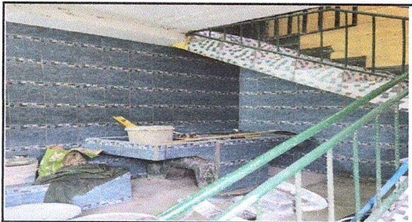
foto:1 colocacion de azulejo para proteger pared de humedad

Observación: Si es necesario se pueden agregar hojas adicionales y actualizar el número de hojas.