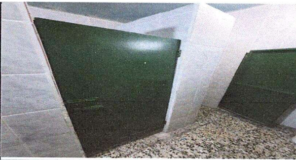
Foto: 1 colocacion de puerta