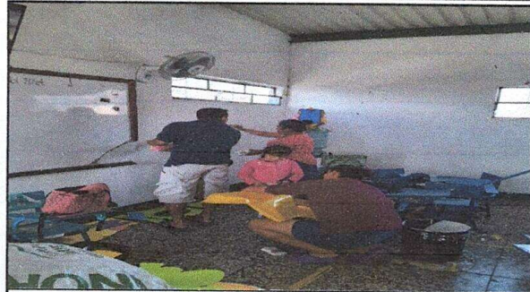
Foto: 1 pintura interior