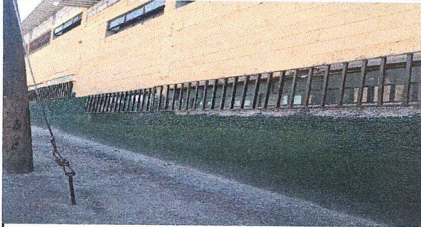
Foto: 1 Colocacion de 5 balcones