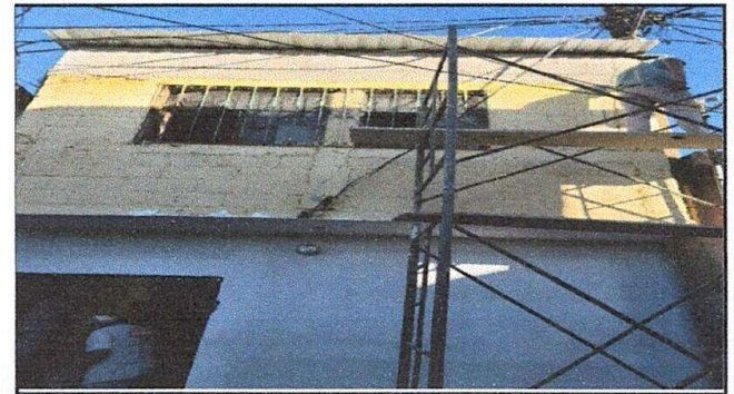
Foto: 1 repello de fachada de la entrada