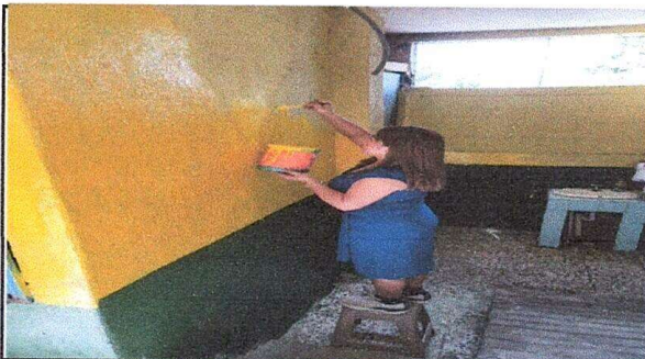
Foto: 1 pintura exterior