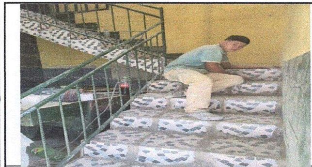
Foto: 1 reparacion de gradas