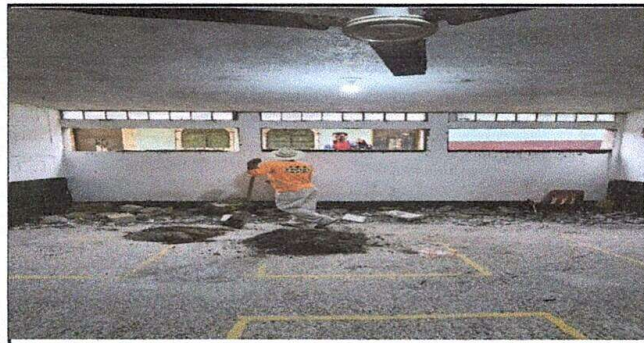
Foto: 1 Apertura para ventanas