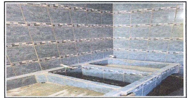
Foto: 1 arreglo de lavado

Observación: Si es necesario se pueden agregar hojas adicionales y actualizar el número de hojas.