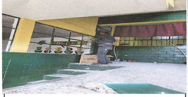
Foto: 1 Cambio de ventanas