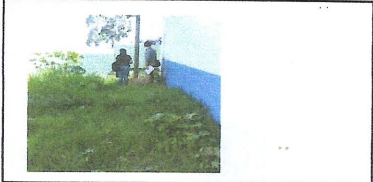
Foto: 2 Evaluación de muro