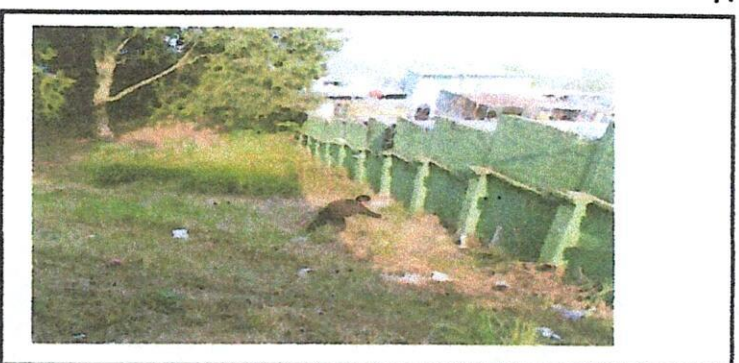
Foto: 6 Muro muy bajo necesita aumentar altura.

Observación: Si es necesario se pueden agregar hojas adicionales y actualizar el número de hojas.