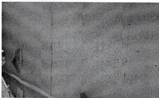
Foto 5: Arreglo de salón, ya que es una división exterior de tabla duroc, la misma, con facilidad la han perforado los estudiantes.