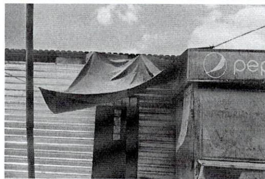
Foto 6: Colocar lámina frente a la puerta de un salón de clases porque por esa parte entra agua de las lluvias.

Observación: Si es necesario se pueden agregar hojas adicionales y actualizar el número de hojas.