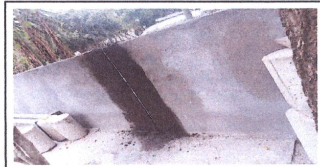
columnas en el muro perimetral

Observación: Si es necesario se pueden agregar hojas adicionales y actualizar el número de hojas.