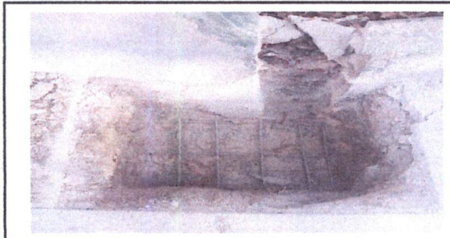
elaboracion de zapatas para columnas en el muro perimetral