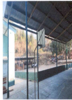
Foto 2: Colocación de canal y bajadas de agua en cancha deportiva