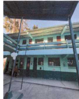
Foto 4: Suministro y aplicación de pintura en paredes del 2do nivel