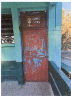
Foto 3: Aplicación de pintura en puertas de salones y colocación de chapa