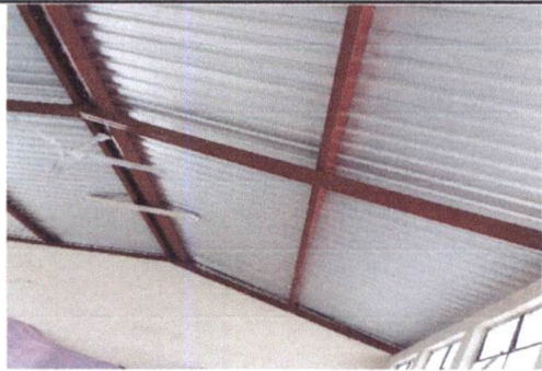
Foto 3 Estructuras remozadas