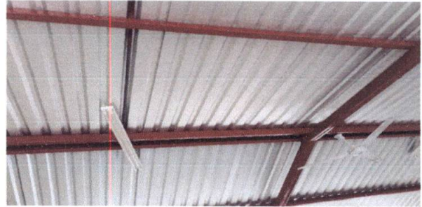
Foto 2 Estructuras de metal limpias y pintadas