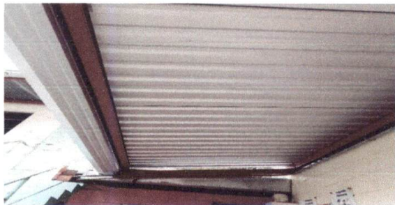
Foto 5 Canales

Observación: Si es necesario se pueden agregar hojas adicionales y actualizar el número de hojas.