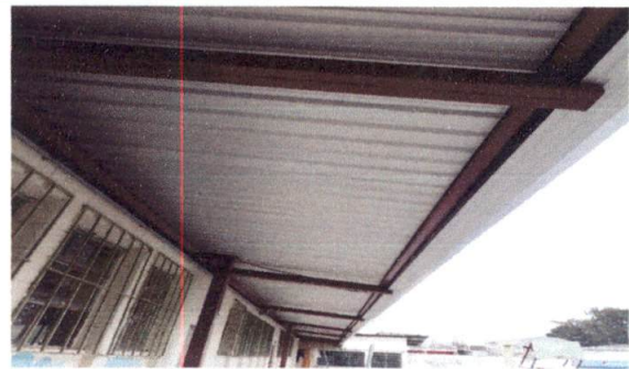
Foto 4 Canales cambiados