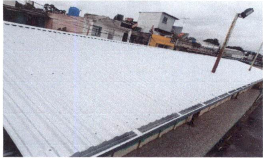
Foto 1 Techado terminado