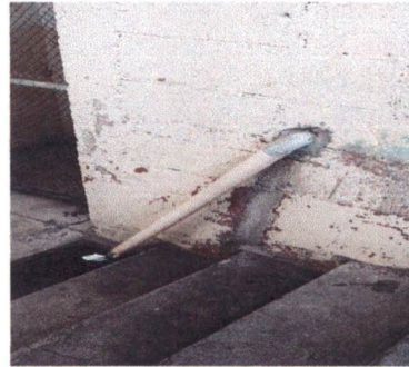
Foto 8 Vista de otro ángulo