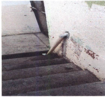
Foto 7 Sustitución de tubería PVC aguas negra, se cambiara para que no quede expuesto.