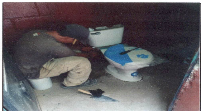
Foto 4: Sustitución de sanitario en el área de preprimaria para niños y niñas