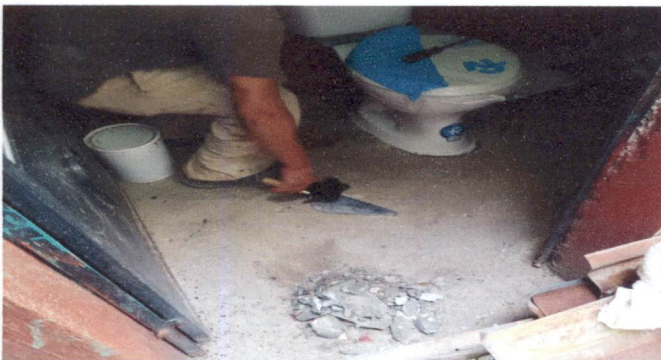
Foto 5: Sustitución de sanitario en el área de preprimaria para niños y niñas