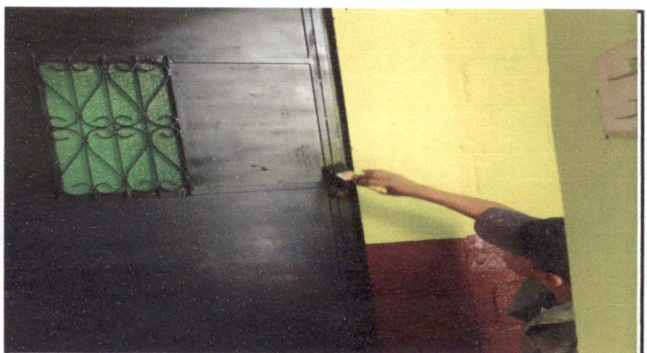
Foto 6: Mantenimiento de estructura de puertas (lijado, cepillado, aplicación de pintura. ( 3 puertas de aulas y 2 baños de niñas y niños)

Observación: Si es necesario se pueden agregar hojas adicionales y actualizar el número de hojas.