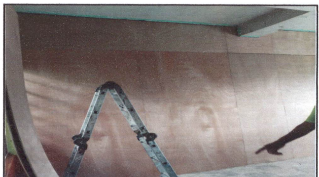
Foto 4: Sustitución de estructura de metal por metal ( para 4 salones)