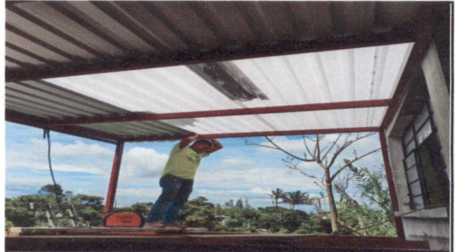
Foto 2: Sustitución de lámina, por lámina troquelada aluzinc calibre 26 y levantamiento de 2 metros para evitar caída de agua ( para 1 salon)