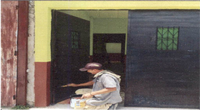
Foto 1 Mantenimiento de estructura de porton (lijado, cepillado, aplicación de pintura).