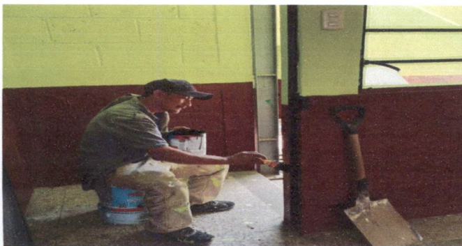
Foto 5: Mantenimiento de estructura de puertas (lijado, cepillado, aplicación de pintura. ( 3 puertas de aulas y 2 baños de niñas y niños)