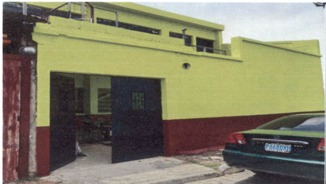
Foto 4: Pintura interior de 5 aulas y 2 sanitarios niñas y niños, exterior del establecimiento.