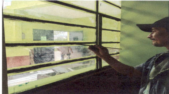
Foto 2: Sustitución de balcones de metal dee 1.20 X 1.40 mts. (Para 4 salones)