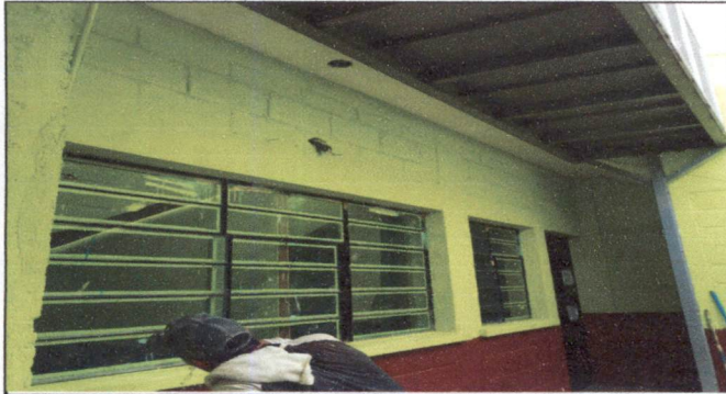
Foto 1: Mantenimiento de estructura de ventanas (lijado, cepillado, aplicación de pintura. ( 4 aulas)