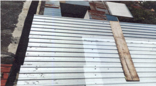
Foto 3: Instalación de tubería para agua pluvial, levantando con lámina para la canaleta y de la canaleta conectado la caída de agua hacia drenaje dentro del establecimiento