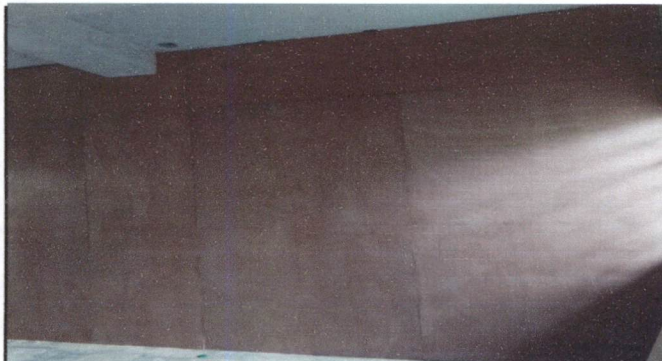
Foto 3: Sustitución de estructura de madera por madera ( para 4 salones)