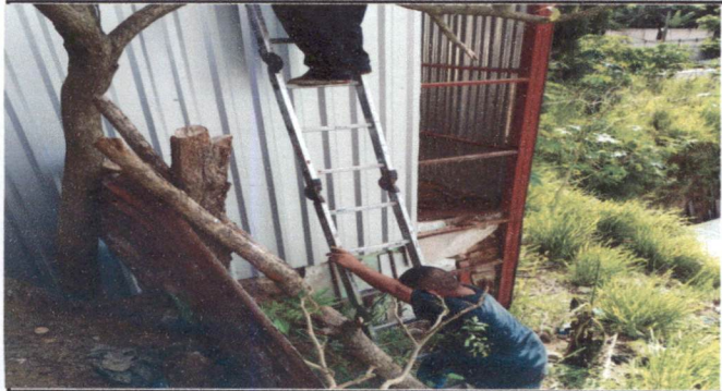
Foto1: Sustitución de lámina, por lámina troquelada aluzinc calibre 26 ( para 1 salon)