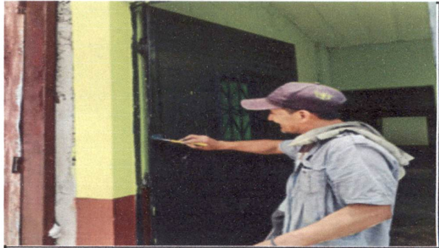
Foto 2: Mantenimiento de estructura de porton (lijado, cepillado, aplicación de pintura)