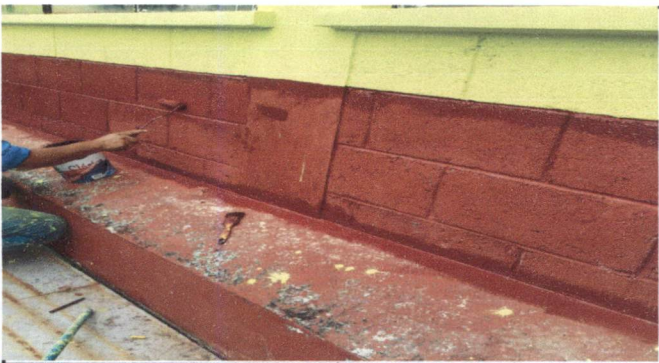
Foto 5: Pintura interior de 5 aulas y 2 sanitarios niñas y niños, exterior del establecimiento