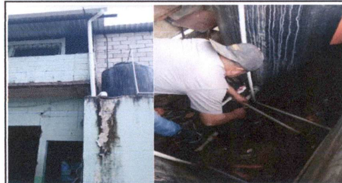
Foto 4: Bajada de agua pluvial, sustitución de accesorios para tanques y cambio de flotes