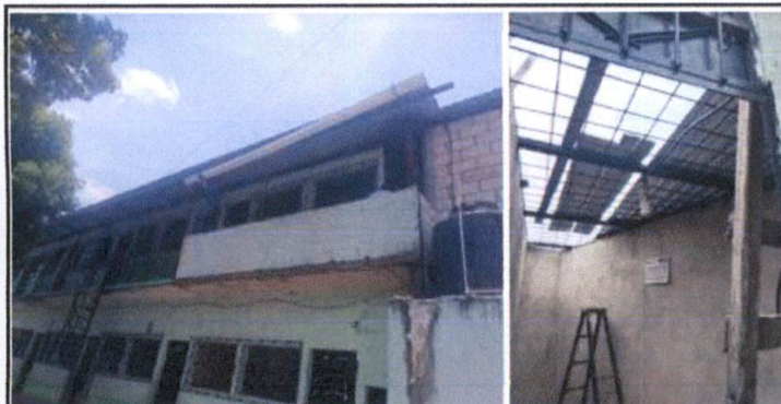
Foto 1: cambio de techo, puesta de canal, repello de pared y pintura de achada de enfrente.