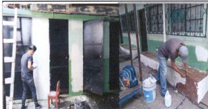
Foto 2: Área de baños, reparación de puertas, cambio de chapas, pintura de pared y cambio de tubería expuesta.