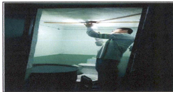
Foto 6: Revisión de soquet, instalación de bombillas ahorradoras y cambio de toma corrientes dobles y apagadores (todo segundo nivel).

Observación: Si es necesario se pueden agregar hojas adicionales y actualizar el número de hojas.