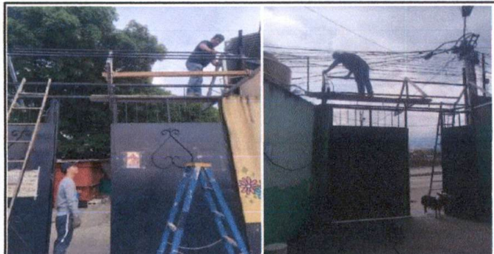
Foto 3: Techo con base de metal de dos aguas para cubierta de portón.