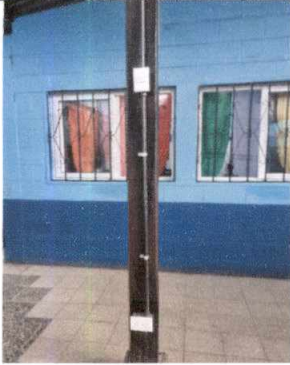
Foto1: INSTALACION DE APAGADORES Y TOMACORRIENTE EN EL PATIO PRINCIPAL