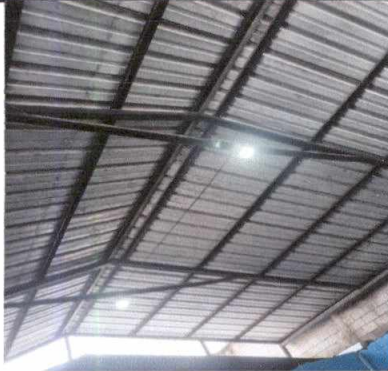
Foto1: INSTALACION DE ILUMINACIÓN EN EL PATIO PRINCIPAL