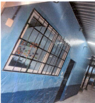
Foto 11 . Instalación de balcones