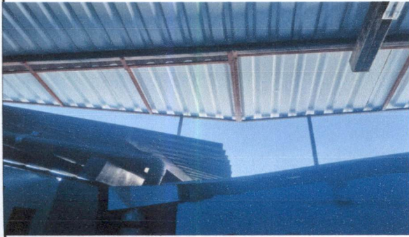
Foto10: Instalación de estructura de metal + lámina de aluzinc