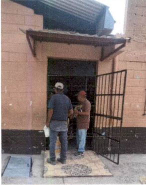
Foto1: Ausencia de techo en la puerta principal