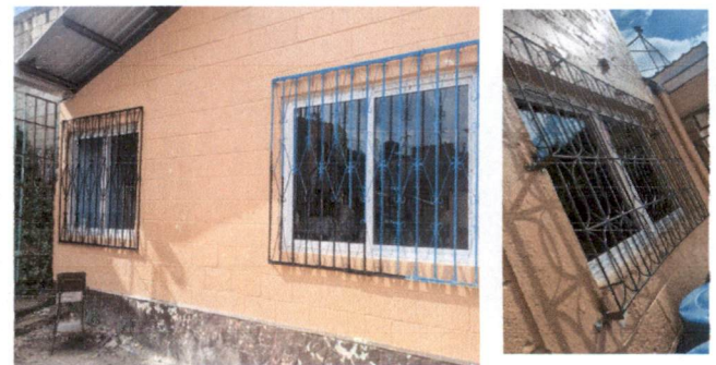
Foto 12. reparación y pintura de balcones

Observación: Si es necesario se pueden agregar hojas adicionales y actualizar el número de hojas.