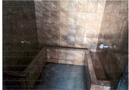
Foto 8 Sustitución de azulejo en Mingitorio