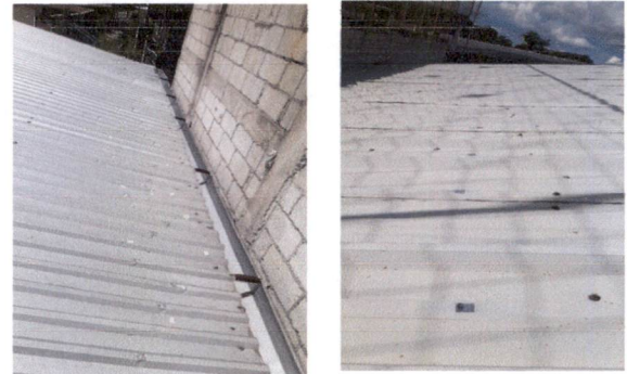
Foto 10. Tapagoteras