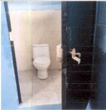
Foto 9 Incorporación de ceramica en Servicios sanitarios