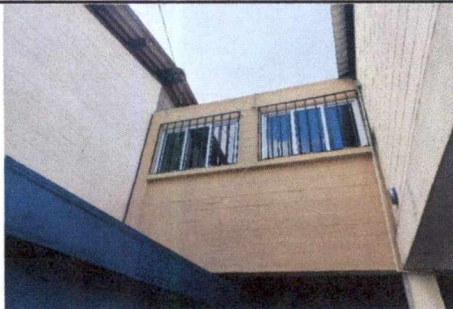
FOTO 5: APLICACIÓN DE PINTURA Y SUSTITUCIÓN DE VENTANAS EN DIRECCIÓN