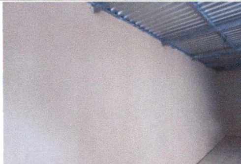
FOTO 8: REPARACIÓN DE MURO DE BLOCK Y APLICACIÓN DE MONOCAPA Y PUNTURA