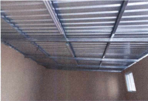
FOTO 1: SUSTITUCIÓN DE LÁMINA POR LÁMINA TROQUELADA CALIBRE 26 Y ESTRUCTURA DE SOPORTE DE METAL EN SALÓN CULTURAL