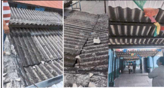
Foto1: Cambio de lamina de pasillo principal