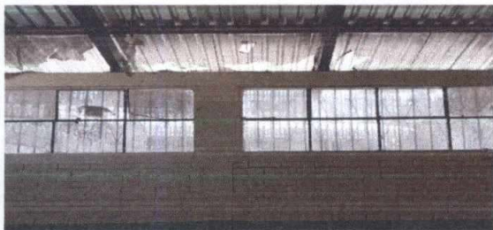
Foto7: 21. Reparación de repello y cenido de pared. 21.2 Cernido de muro

Observación: Si es necesario se pueden agregar hojas adicionales y actualizar el número de hojas.