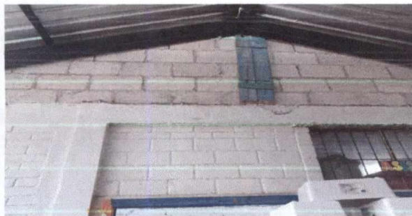
Foto 3: 9. Pintura en muros interiores y exteriores. 9.1 Pintura en muros interiores y exteriores.