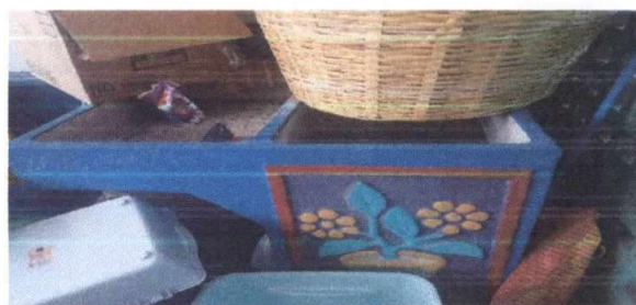
Foto 6: 20. Reparación de cocina. 20.9 Sustitución de Lavatrastos. 20.10 Sustitución de pila de cemento de dos lavaderos. 20.14 Fabricación de encimera de concreto incluyendo azulejo.

Observación: Si es necesario se pueden agregar hojas adicionales y actualizar el número de hojas.