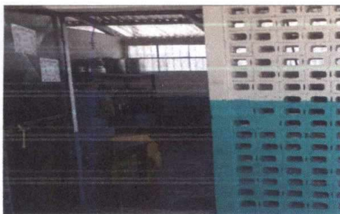
Foto 5: 19 Mano de Obra. 19.9 Desinstalación de estructura portante. 19.11 Instalación de unidad de luz. 19.12 Instalación de unidades de fuerza. 19.22 Instalación de chorros.