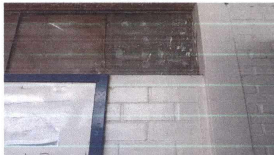
Foto 4: 13. Reparación y sustitución de azulejos. 13.2 Instalación de piso azulejo.