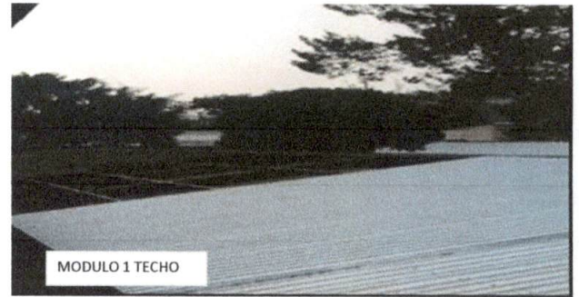
Foto 2: Sustitución de lamina Duralita, por lamina troquelada aluzinc calibre 26. Módulo 1, Vista Superior.