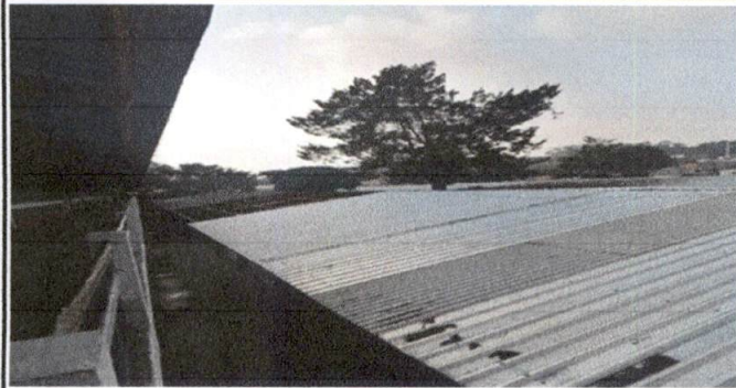
Foto 1: Vista panorámica del Módulo 1. Grados que ocupa: Primero Básico, Secciones A, B, C, D y E ; Segundo Básico, Sección "A". Más de 40 años con techo de Duralita.