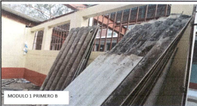
Foto 5: daño en cubierta de Duralita, en el salón que ocupa Primero Básico, Sección "B"