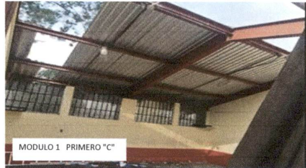
Foto 4: daño en cubierta de Duralita en el salón que ocupa Primero Básico, Sección "C"