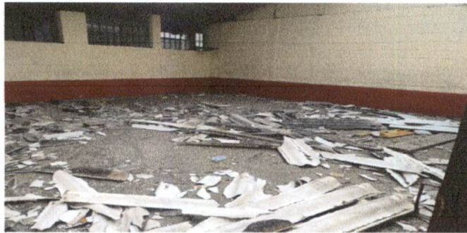
Foto 3: daño en cubierta de Duralita en el salón que ocupa Segundo Básico, Sección "A"