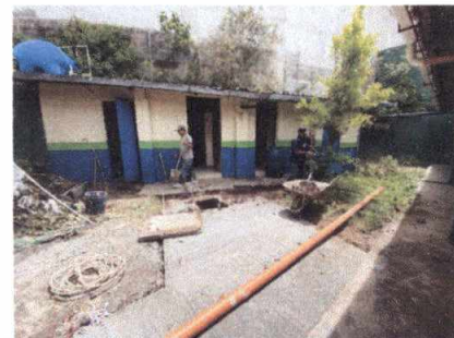
Foto 6: Fabricación de losa de patio en área de sanitarios de alumnos y alumnas.

Observación: Si es necesario se pueden agregar hojas adicionales y actualizar el número de hojas.