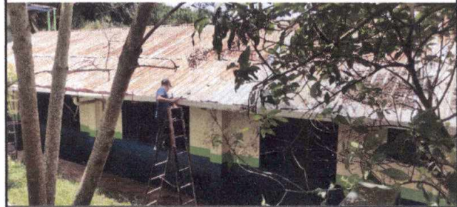
Foto 4: Sustrucción de canal PVC en área de salones de 4to. Y 5to PC, parte trasera