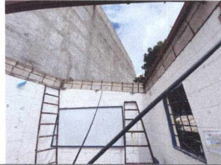
Foto 8: Fabricación de 2 filas de block en el salón de 6to. Perito contador