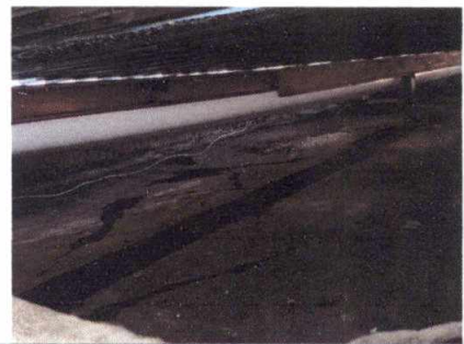
Foto 12: Instalación de lámina de losa para evitar acumulación de agua

Observación: Si es necesario se pueden agregar hojas adicionales y actualizar el número de hojas.