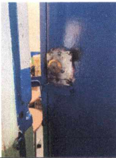
Foto 3: Cambio de chapa Yale a Puertas de área de computación y administrativa.