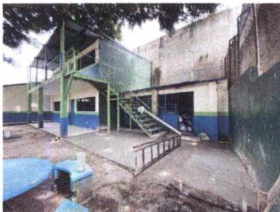
Foto 5: Fabricación de losa de patio, hacia salon de 5to. Bachillerato y bodega.