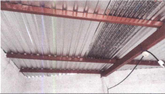
Foto 7: Sustrucción de lámina en el salón de 6to. Perito contador