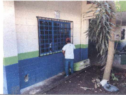
Foto 2: Instalación de balcones en área de computación y administrativa