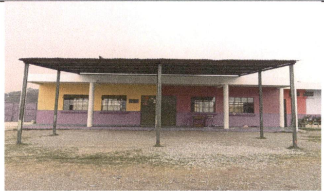
Foto 2: SUSTITUCION DE LAMINA POR LAMINA DE TROQUELADA ALUZINC CALIBRE 26 EN GALERA PATIO DE LA ESCUELA