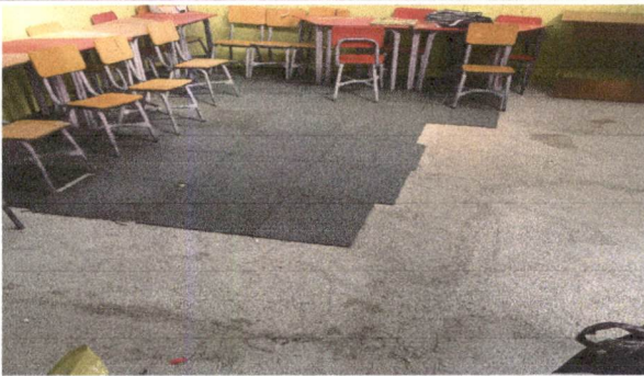
Foto 3: SUSTITUCION DE PISO DE TORTA DE CEMENTO POR PISO ANTIDESLIZANTE EN MODULO 1 Y MODULO 2 (SEIS AULAS)