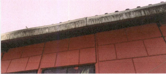
Foto1: CANALES DE METAL EN MAL ESTADO