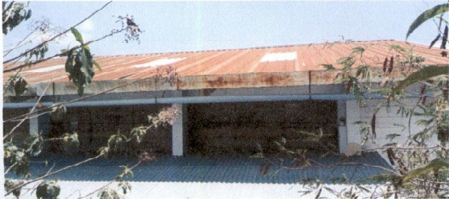
Foto 1: Sustitucion de lamina por lamina troquelada aluzinc calibre 26