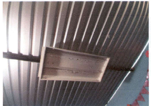
Foto 4: Reparacion de lamparas, varias, sistema electrico, sustitucion de toma corrientes.