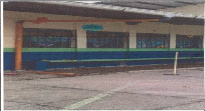
FOTO 4: REPARACION DE BAJADA DE AGUA PLUVIAL, TUBO PVC 3"