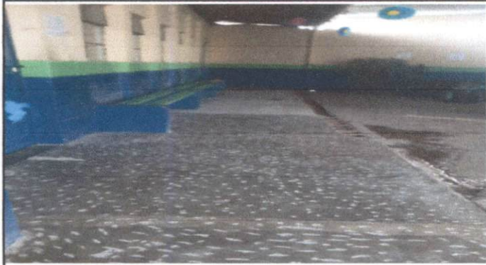
FOTO 1: REPARACION DE PISO DE TORTA DE CONCRETO POR PISO CERAMICO