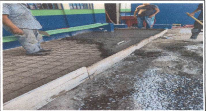
FOTO 2: SUSTITUCION DE PISO DE TORTA DE CONCRETO POR PISO CERAMICO DE PATIO