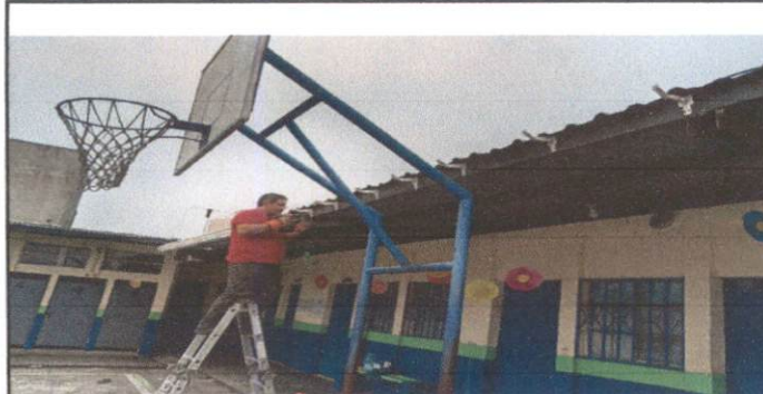
FOTO 5: SUSTITUCION DE SOPORTE O PESCANTE DE METAL PARA CANAL GAZA 4", PLANA DE 1" x 1/4", DE 0.35 mm ANCHO