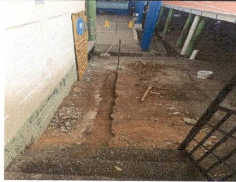
FOTO 2: Reparación de tubería de 4'' 80 PCI línea principal de agua pluvial.