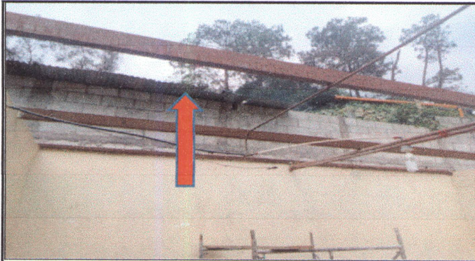
Foto 1: CUBIERTA DE LÁMINA: Sustitución de lámina, por lámina troquelada aluzinc calibre 26. en aula de párvulos y 1ro. B