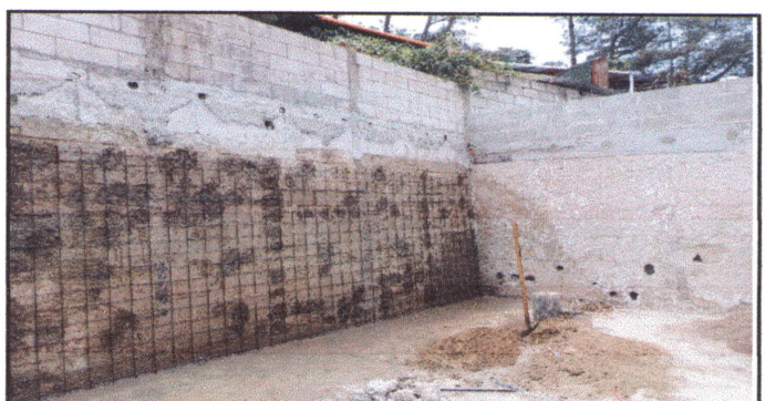
Foto 6: MUROS PERIMETRALES, REPARACION DE REPELLO Y CERNIDO DE PAREDES: Reparación de muro perimetral de block (incluye levantado de altura), Repello en muro (incluye limpieza), Cernido en muro. En aulas de párvulos y 1ro. B.

Observación: Si es necesario se pueden agregar hojas adicionales y actualizar el número de hojas.