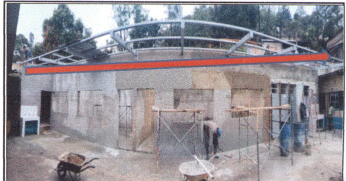
Foto 4: Sustitución de canal de metal y Sustitución de soporte o pescante de metal para canal, frente a párvulos, 1ro. B y baños. Eliminación de postes de metal.