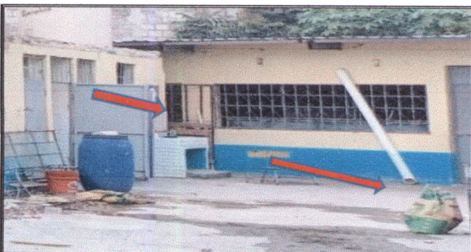
Foto 5: Reparación de bajada de agua pluvial, tubo PVC 4" que se encuentran a la par de los baños, frente a prepa y a la par de 6to.