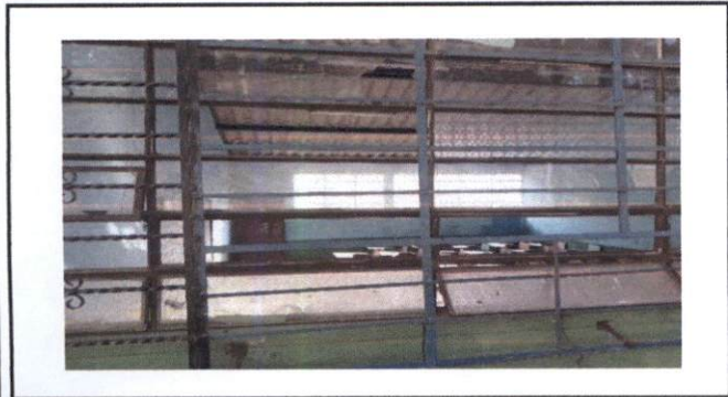
Foto: 7 Cambio de vidrio