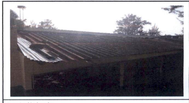
Foto: Cambio de techo