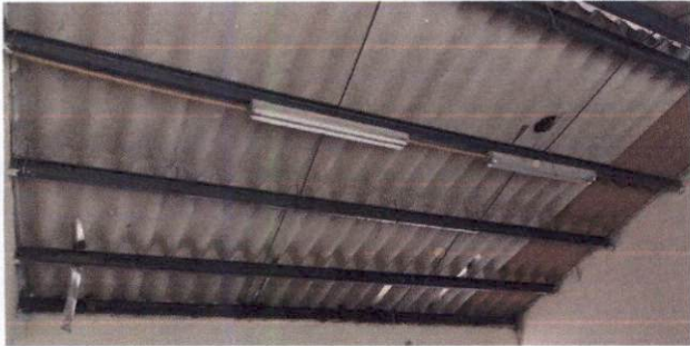
Foto1: Cambio de lámina