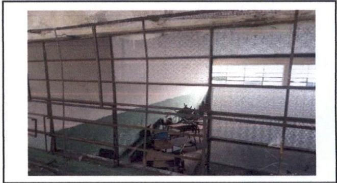
Foto: Cambio de vidrio