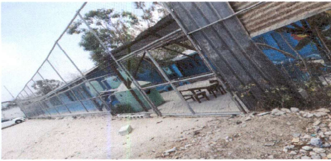
Foto1: Reparación de muros de contención