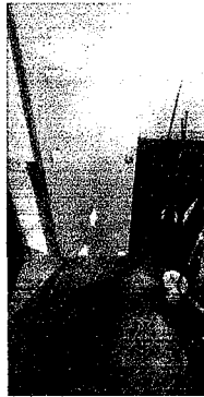
Foto 3: Colocación de puertas nuevas, de todos los baños pues ya estan en muy mal estado.