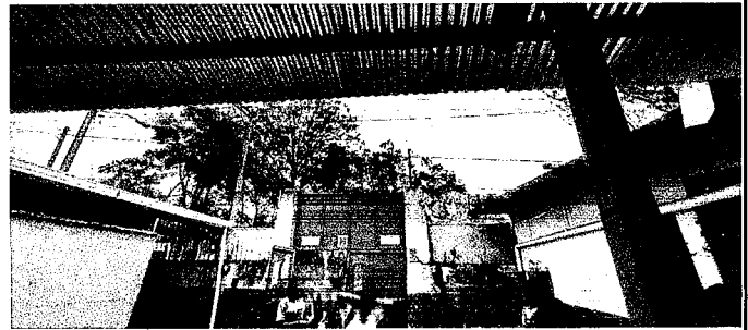
Foto 6: Colocar techo en la entrada principal del establecimiento para cubrir del sol y de la lluvia esa parte de la Escuela .

Observación: Si es necesario se pueden agregar hojas adicionales y actualizar el número de hojas.