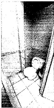
Foto 5: Colocación de 7 baños nuevos porque los que actualmente tiene la escuela estan en malas condiciones.