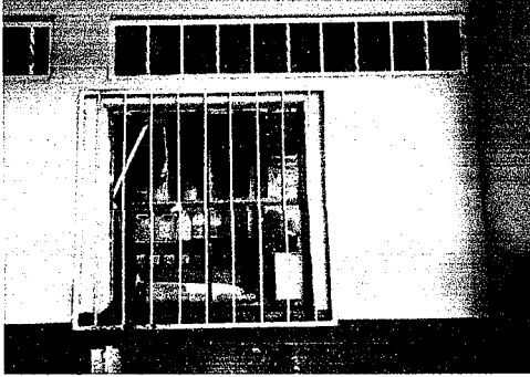
Foto1: Colocación de nueva ventana corrediza, pues esta totalmente sellada y se requiere de ventilación necesaria.