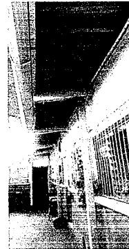
Foto 4: Colocación de nuevo techo de 3 aulas, porque en invierno entra mucho la lluvia y es necesario el cambio porque el techo es de duralita y esta dañado, necesario el cambio por la seguridad de los niños.