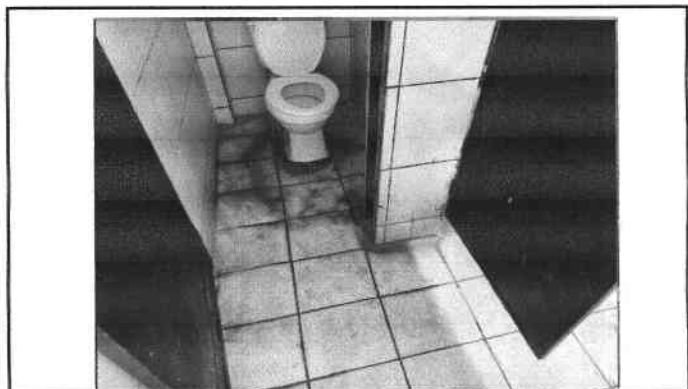
Foto 3: Modulo Baños, se debe sustituir sanitarios y colocar piso antideslizante