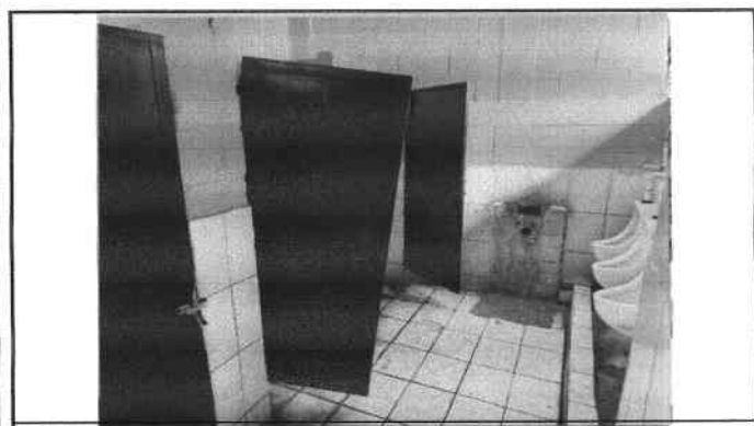
Foto 5: Puertas de sannitarios en mal estado es necesario sustituirlas