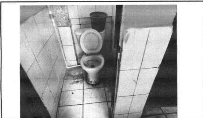
Foto 4: Modulo Baños, se debe sustituir sanitarios y colocar piso antideslizante