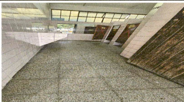
Foto 5: REMOZAMIENTO DE MUROS PINTURA DE INTERIORES DE SERVICIO SANITARIO