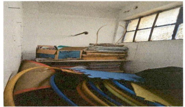
Foto 8: SUMINISTRO Y COLOCACION DE TUBERIA PARA DRENAJE Y AGUA POTABLE.