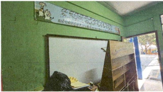
Foto7: SUMINISTRO Y COLOCACION DE LAVAMANOS E INODORO PARA EL SERVICIO SANITARIO..