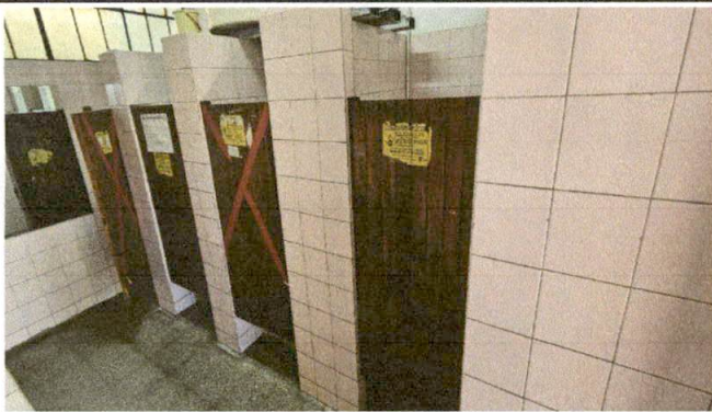
Foto 3: SUMINISTRO Y COLOCACION DE PUERTAS PARA SERVICIO SANITARIO