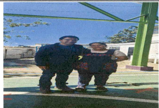
Foto 12: EVALUADOR DE CAMPO ACOMPAÑADO DE LA PRESIDENTA DE LA OPF,