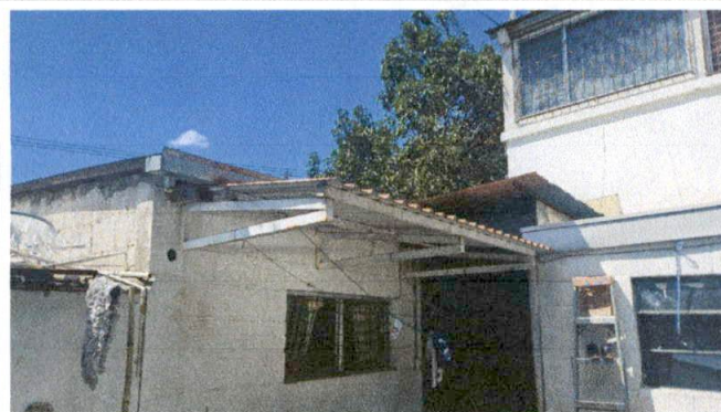
Foto 9: MEJORAMIENTO TECHO LAMINA Y CANAL TROQUELADO PARA AREA RECREATIVA.