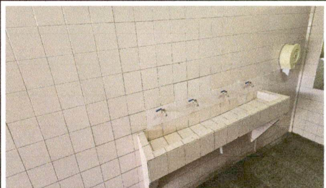
Foto 4: REMOZAMIENTO DE SERVICIO SANITARIO EN SUMINISTRO Y COLOCACION DE ACCESORIOS PARA LE BAÑO.