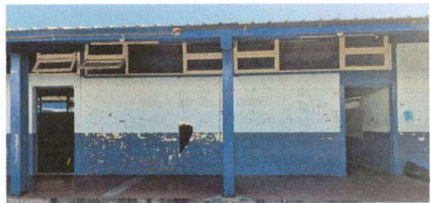
REGLONES No. 9

Observación: Si es necesario se pueden agregar hojas adicionales y actualizar el número de hojas.