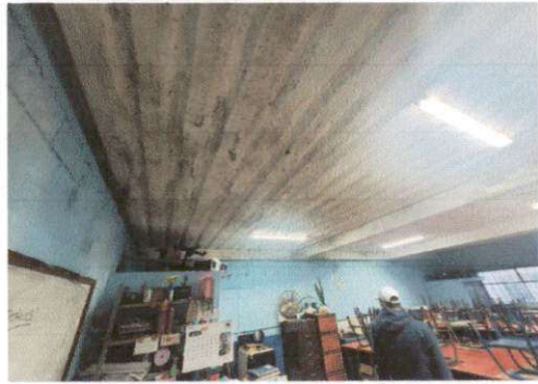
REGLONES No. 21