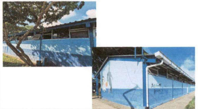
REGLONES No. 5