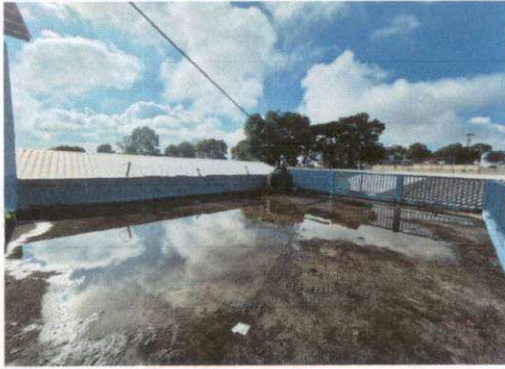
REGLONES No. 2, 6, 7, 9, 16, 17