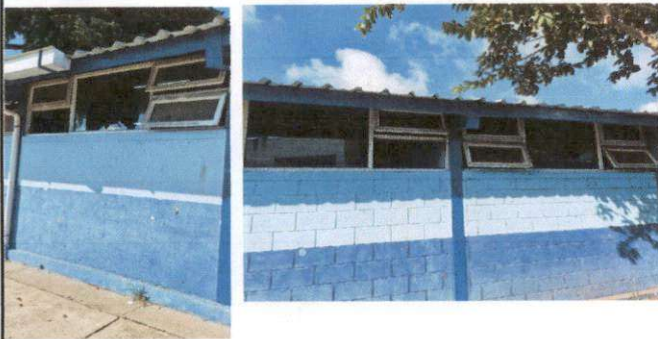
REGLONES No. 5