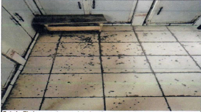
Foto1: El piso ya esta muy deteriorado.