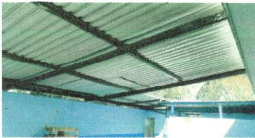
Foto 3: Sustitución de lamina acanalada y sus soportes en servicios sanitarios