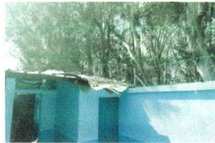
Foto 4: Sustitución de lámina acanalada por lámina troquelada aluzin calibre 26