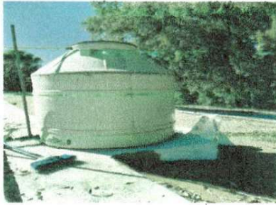
Foto1: Impermeabilización de Losa sobre tres aulas y dirección