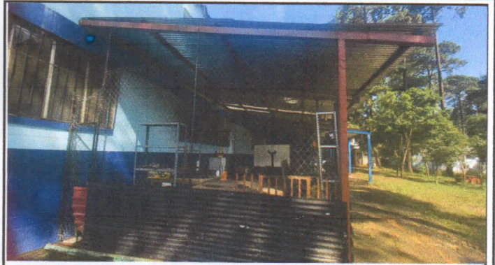
Foto 2: TALLER DE MECÁNICA SERA ILUMINADO, Y SE PONDRÁ TOMACORRIENTES