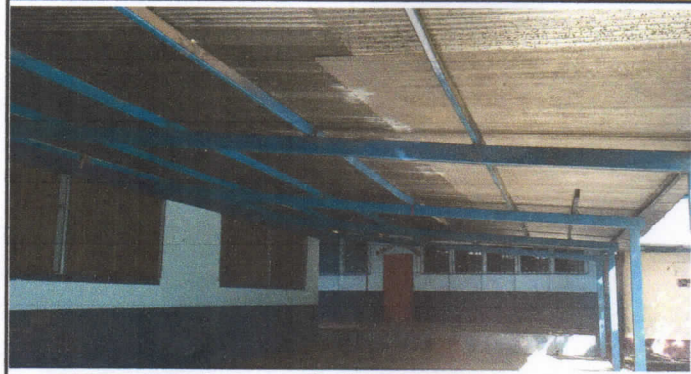
Foto1: GALERA DE USOS MULTIPLES SISTEMA COLAPSADO. SE ARREGLARA EL SISTEMA ELCTRICO Y SE ILUMINARÁ CON 8 FOCOS