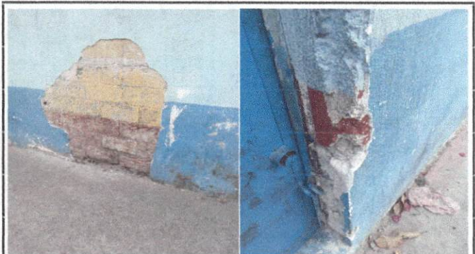
Foto 4: Repello en la columna de la puerta principal del instituto y pared de la parte exterior.