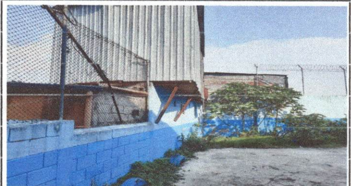
Foto 4: levantamiento de pared ya que las casas vecinas pueden ingresar con facilidad al establecimiento.