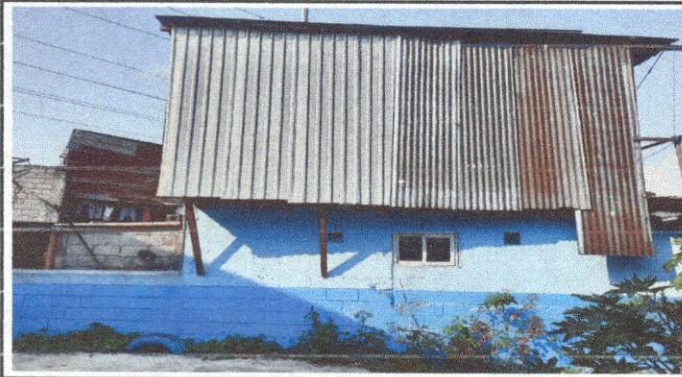
Foto 1: levantar pared perimetral, ya que los vecinos han invadido espacio del establecimiento en area de juegos.