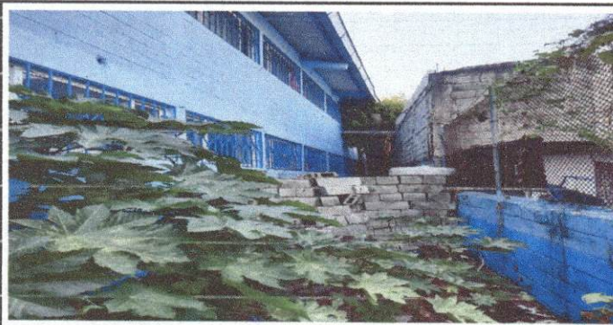
Foto 5: simiento de torta ya que se acumula demasiadas plantas silvestres y esto provoca creadero de zancudos y nido de ratas.