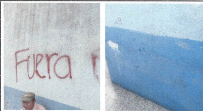
Foto 3: Pintura deteriorada en la parte externa e interna del establecimiento.