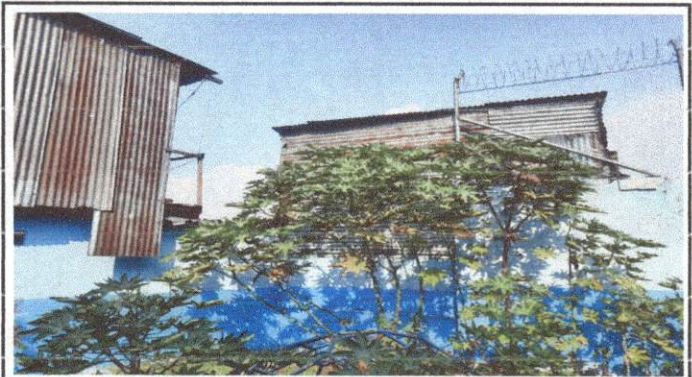
Foto 2: levantamiento de pared ya que las casas vecinas pueden ingresar con facilidad al establecimiento.