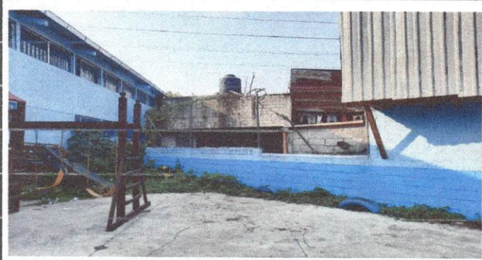
Foto 3: levantamiento de pared ya que las casas vecinas pueden ingresar con facilidad al establecimiento.