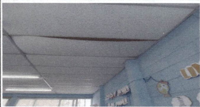
Foto 1: Mantenimiento de cielo falso en el aula de segundo sección B y pasillo.