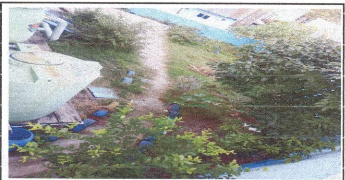
Foto 6: simiento de torta ya que se acumula demasiadas plantas silvestres y esto provoca creadero de zancudos y nido de ratas.

Observación: Si es necesario se pueden agregar hojas adicionales y actualizar el número de hojas.